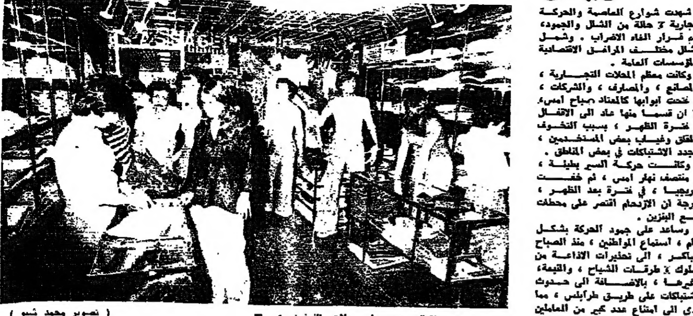
اتصال محدود على محلات التوتيريه